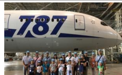
ANA社とのコラボ企画 機体工場見学の模様