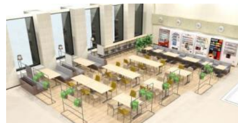
社内サテライトオフィス「SOMPOラウンジ」