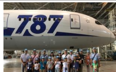
ANA社とのコラボ企画 機体工場見学の模様